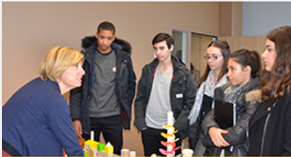
" 5 sens - 5 métiers : l'envie d'entreprendre " avec le Club AJE Rhône-Alpes