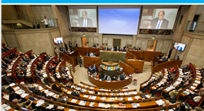
Colloque AJE 2016 " Equation du futur : jeunes et emploi "