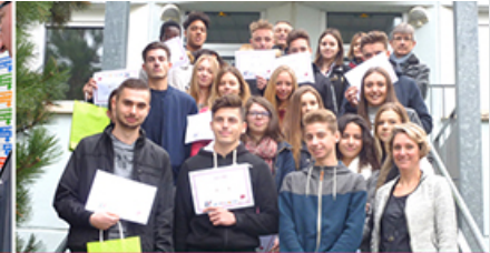
" Reporters aujourd'hui, acteurs de l'entreprise demain ! " avec le Club AJE Lorraine