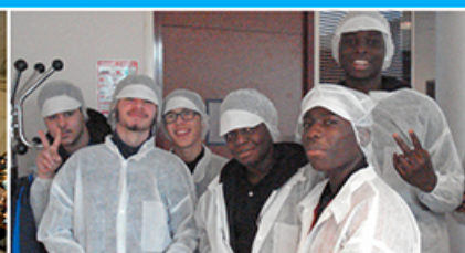
Visite d'entreprise avec le Club AJE Essonne