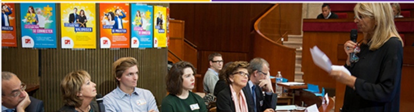
Nos entreprises partenaires répondent aux jeunes et s'engagent pour l'emploi