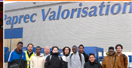
Visite d'entreprise avec le Club AJE Seine-Saint-Denis