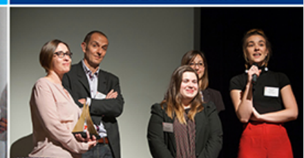
Concours national " Challenge AJE "

Pour donner à l'apprentissage des jeunes toutes les chances de réussite, l'Association Jeunesse et Entreprises vous invite à lui apporter votre soutien et participer au développement de ses actions par le versement de votre taxe d'apprentissage.