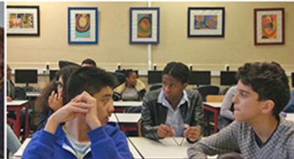
Ateliers de coaching pour lycéens avec le Club AJE Paris