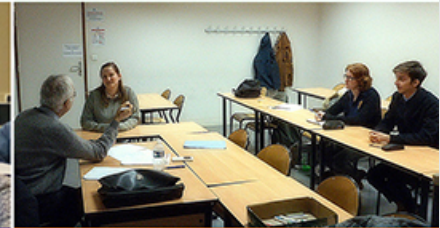
Aide à la recherche d'emploi avec le Club AJE Auvergne