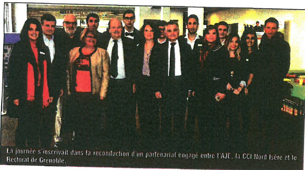
La journée s'inscrivait dans la reconduction d'un partenariat engagé entre l'AJE, la CCI Nord Isère et le Rectorat de Grenoble.

« 5 sens, 5 métiers : l'envie d'entreprendre », est construite avec la volonté commune d'aider les jeunes à trouver leur voie, le tout avec une approche originale, en collaboration avec le soutien du Conseil Départemental de l'Isère. Elle a été imaginée dans le but d'éveiller chez les jeunes l'envie d'entreprendre et de s'engager dans une dynamique innovante