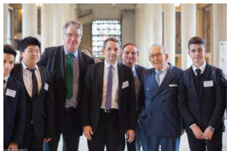
Jean-Paul Delevoye, président du CESE, Thierry Mandon, Secrétaire d'Etat chargé de l'Enseignement supérieur et de la Recherche, et le président Yvon Gattaz

« Rempacer notre devise nationale de 1848, qui a noblement servi, par une nouvelle affichant la nouvelle priorité des priorités : "l'emploi, l'emploi, l'emploi" . »