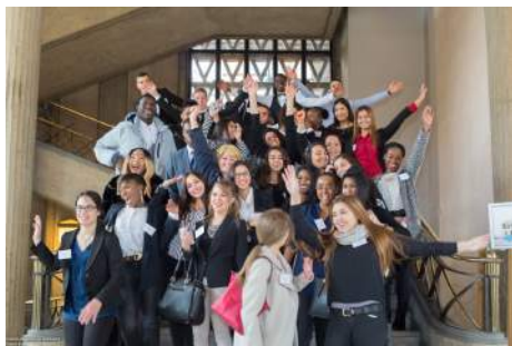
"Soyons fous avec les jeunes !"

Des sourires et une bonne ambiance visibles sur les photos du colloque ! :)